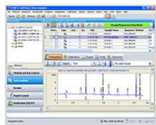
OpenLab CDS ChemStation Edition C.01.07