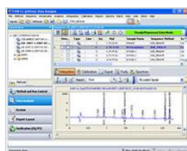
OpenLab CDS ChemStation Edition