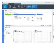
OpenLab CDS 2.7