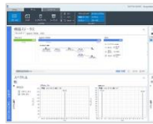
OpenLab CDS 2.7